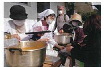
【防災キャンプ 煙道体験】【炊き出し訓練】