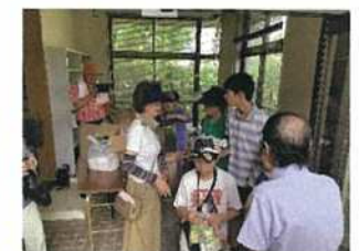
【深柢ガーデンでの避難訓練】