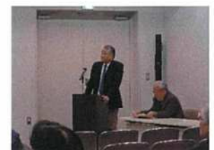
【内山下・深柢合同防災勉強会】