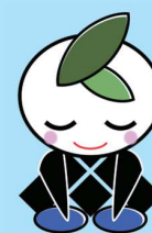
くらしき環境キャラクター 「くらしふ」