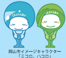
岡山市イメージキャラクター 「ミコロ、ハコロ」