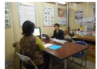
個別相談にも随時対応 (写真はESD・市民協働推進センター)