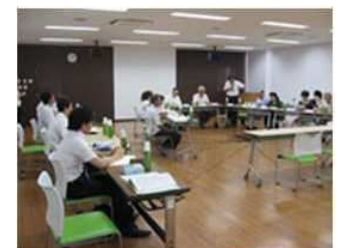
各区で実施される審査会の様子