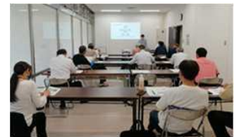
年2回開催される募集説明会の様子 (概ね12月と6月)