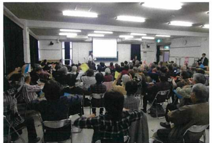
【南輝いきいき活動交流会】の風景