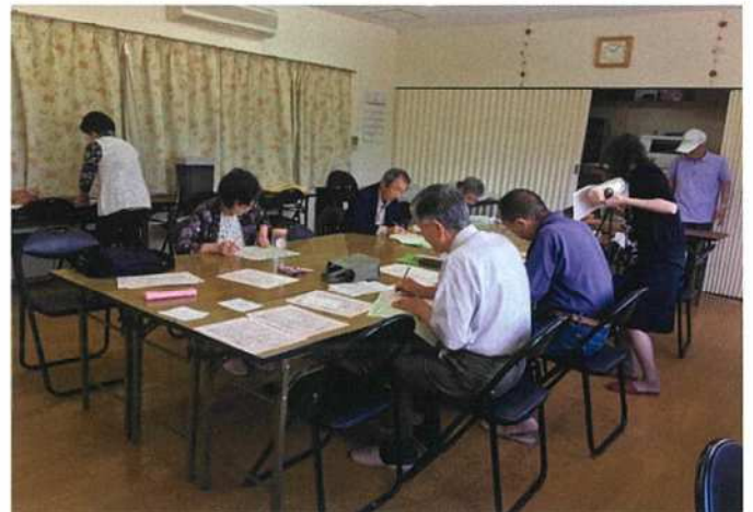
【シルバー見守り隊】あんしんカード更新確認風景