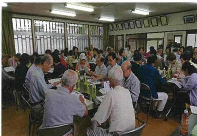
【南輝ケア会議】全体会の風景

南輝ケア会議は、毎月1回開催しており、偶数月に企画会、奇数月は全体会を開催しています。