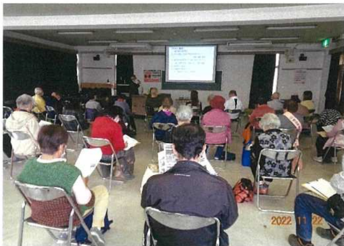
「西日本豪雨災害」の防災講演会風景