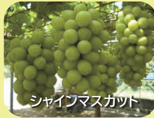
シャインマスカット