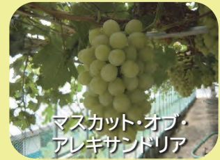
マスカット・オブ・アレキサンドリア