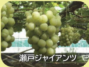
瀬戸ジャイアンツ

「くだもの王国岡山」と呼ばれるように、温暖な自然条件を活かし、多彩な果樹が盛んに栽培されています。特に、ももとぶどうは名実ともに岡山を代表する果物であり、全国から多数の引き合いがあります。