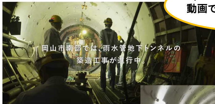
岡山市南部では、雨水管地下トンネルの築造工事が進行中。