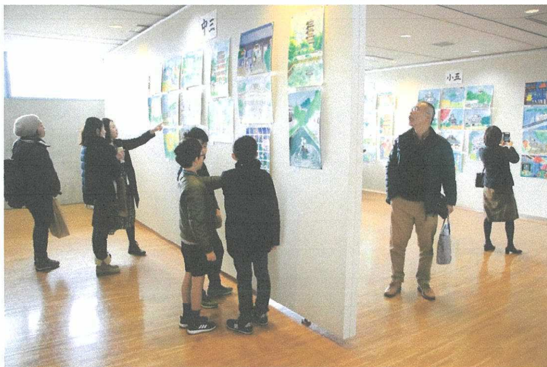
「絵で伝えよう私の町のたからもの絵画展」の様子