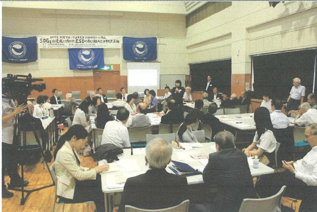
「2019 中国ブロック・ユネスコ活動研究会 in 岡山」の様子（全体ディスカッション風景）