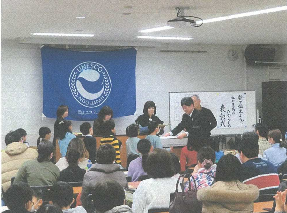
「絵で伝えよう私の町のたからもの絵画展の表彰式及び記念講演会」の様子