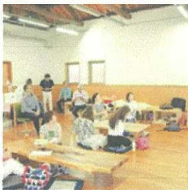
9/18 (水) はまはうす (妹尾)