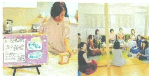
11/6 (水) まえだ診療所 (妹尾)