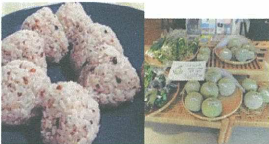
11/10 (日) 暮らしのたね (問屋町)