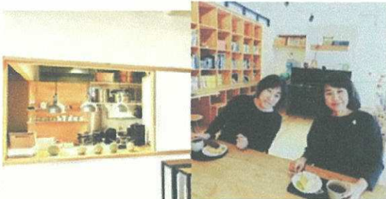
11/3 (日) 暮らしのたね (問屋町)