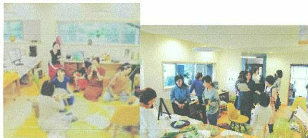
10/2 (水) まえだ診療所 (妹尾)