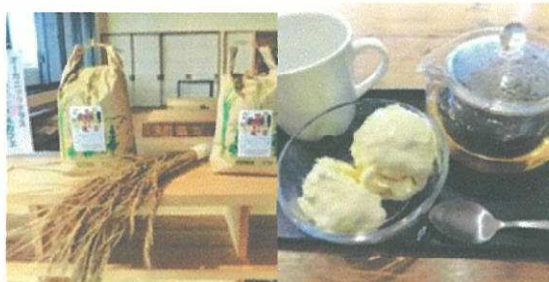
11/24 (日) 暮らしのたね (問屋町)