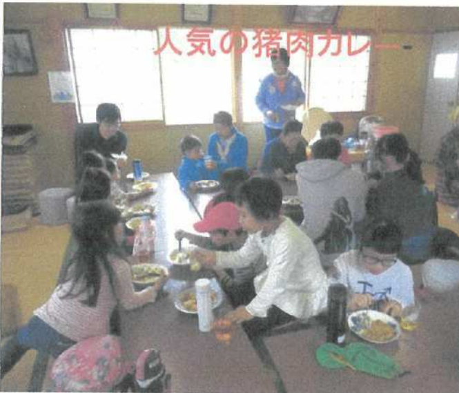
人気の猪肉カレー