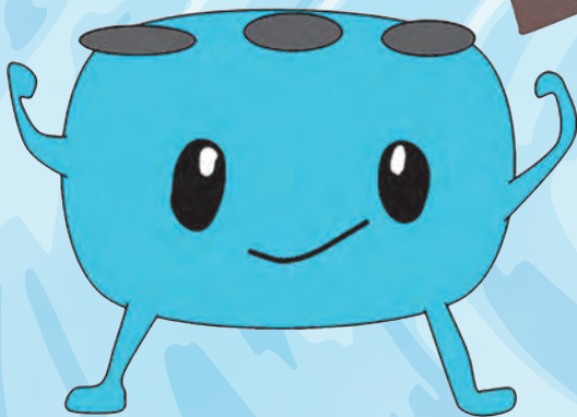
정화조 조타로 군