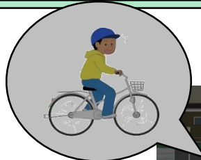
無灯火運転（ライトをつけずに走る）