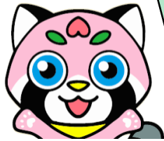
岡山市交通安全キャラクター「まもも」

みんなが住んでいる岡山市では、お仕事や学校に自転車を利用する人が多いんだよ。でも、残念ながら、自転車の交通事故は多く、マナーもよくない、ということで、みんなが自転車を安全に正しく使えるようにこの条例が作られたんだよ！