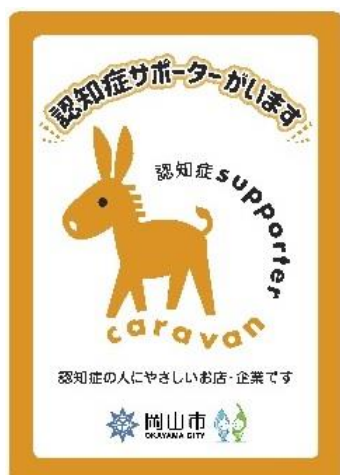
認知症サポーターステッカー