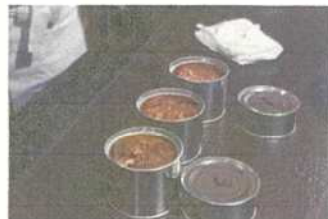
試作で出来上がった缶詰4種