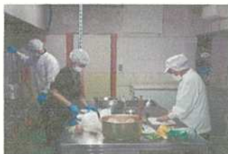
開発風景(ののもんにて)

缶詰は2021年3月にレシピ4品をつくり、缶詰工場の「ののもん」にて制作、うち2品を2021年9月に製品化