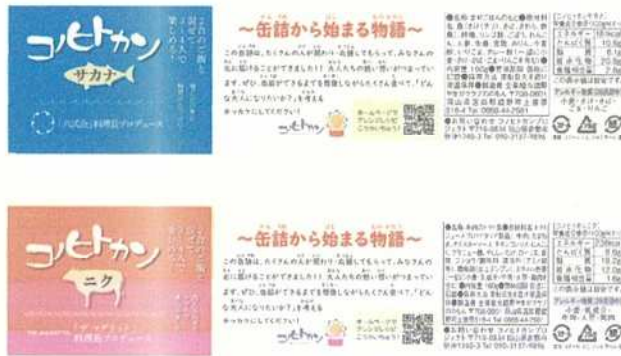
品質表示等のラベル

2021年12月に岡山県児童養護施設や岡山県内の子ども食堂や社会福祉協議会、チャリティーセンターなど支援団体23か所に支援致しました。