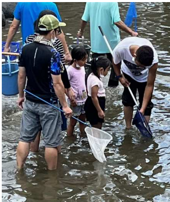
倉安川の生き物調査の様子