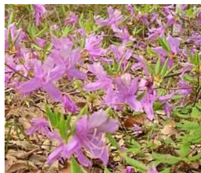
コバノミツバツツジ