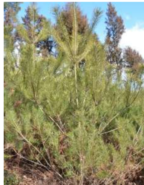
アカマツ(桃太郎松)