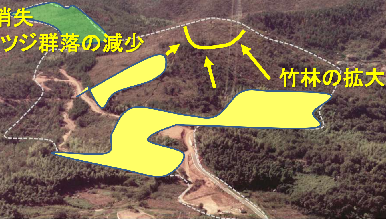
昭和48～50年頃(約50年前)の岡山市今谷地区の里山風景(----- 校地境界)