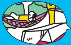
趣味を楽しみながら～