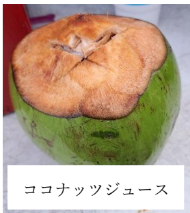
ココナッツジュース

食事はホストファミリーの家では毎日お米を炊いていて、日本食のレストランもありました。また、ハンバーガーやパンケーキは1つがとても大きく、チャモロ人の伝統的な食べ物であるケラグエンやレッドライスはとてもおいしかったです。また、ナイトマーケットの際にココナッツジュースを飲んだ後にココナッツを開いて身の部分を食べる「ココナッツ刺身」は、日本の刺身に匹敵するくらい新鮮でおいしかったです。