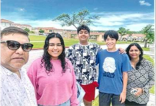
父 姉 子 自 母 (15才)分