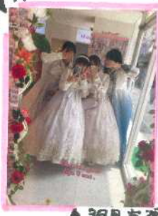
▲ 31日 富川...