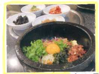
▲ 6日目 石焼地鍋

韓国で食べたものは、あたたかいものは、あたたかいうちに出てきました。ピピョンは、あついなべに入水られて出てきました。焼肉やフジコキなど目の前で調理されることも多かったです。だからこそ、できたての美味しいものをたくさん食べるのができました！そして、おつまみの種類も多士にもおどろきました。一口ごとに違う味があったため、本当においしかったです。