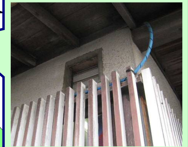
換気扇の通風部分の破損