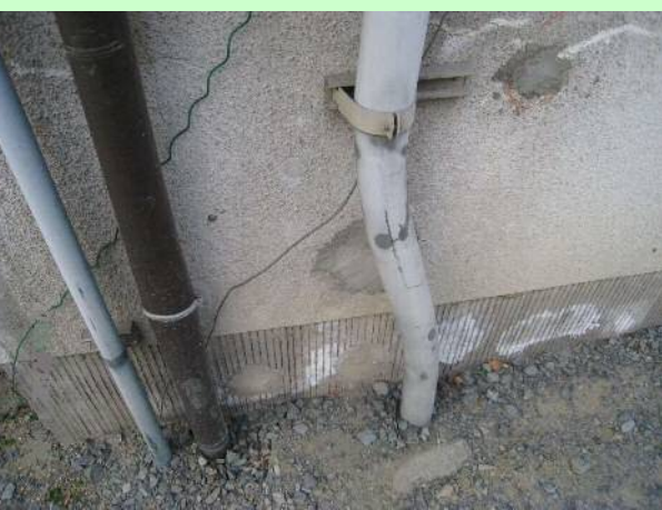
基礎部分などのすき間 (写真は穴埋めした跡)