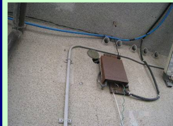
エアコン配管の壁貫通部分