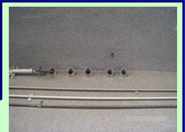
電線の壁貫通部分