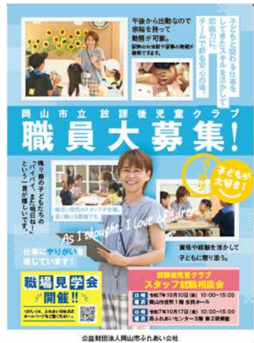
■ 県内主要新聞紙への折込チラシ（令和7年10月、令和8年2月）