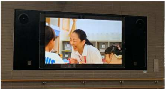
■ 岡山駅デジタルサイネージで動画を掲出（令和7年7月～令和8年2月）