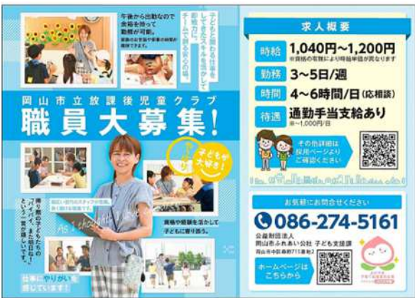
■ 幅広い世代で読まれている県内情報誌への広告掲載（令和8年1月、2月号）