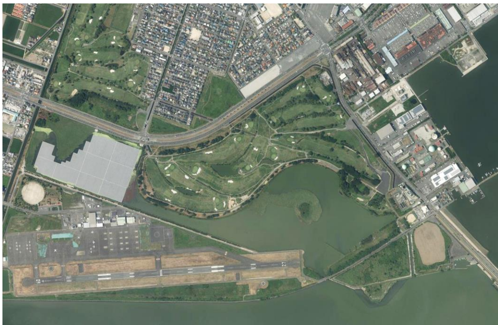
※国土地理院地図から引用