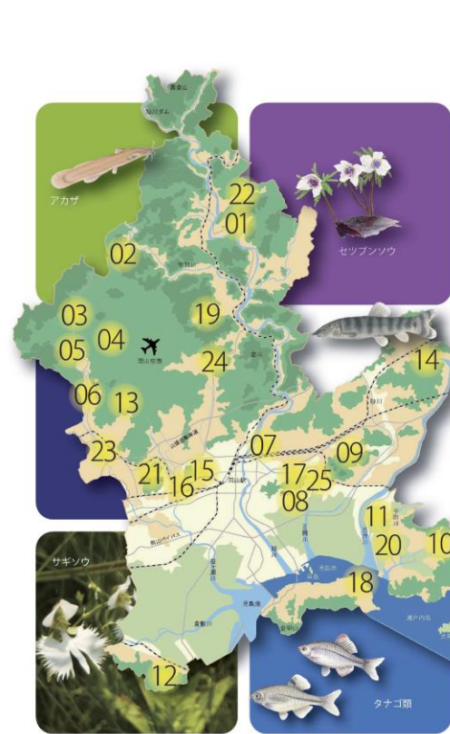
岡山市身近な生きものの里の位置