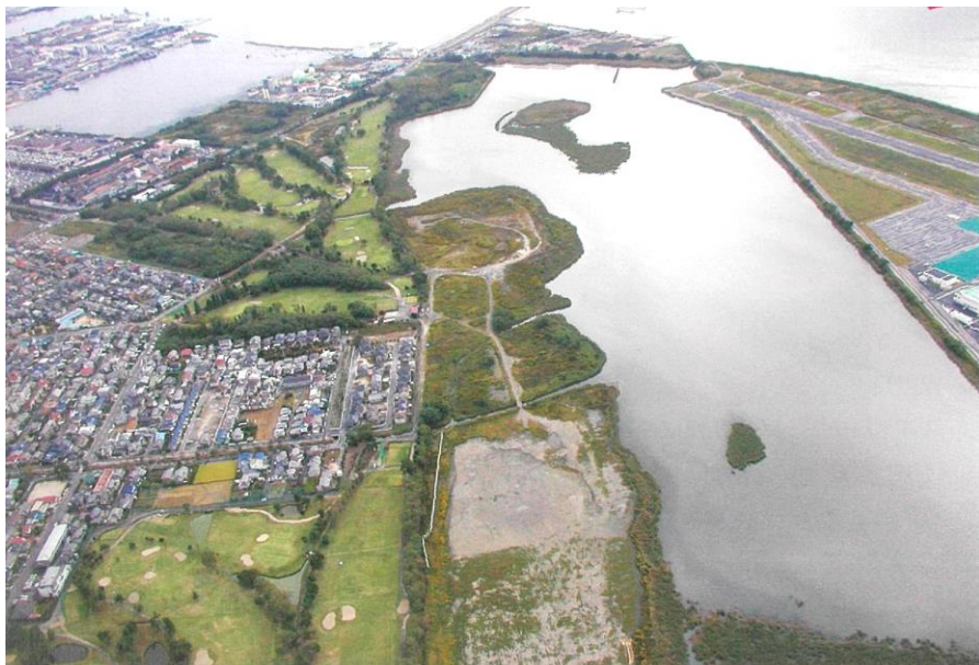
※日本野鳥の会岡山県支部設立30周年記念誌から引用