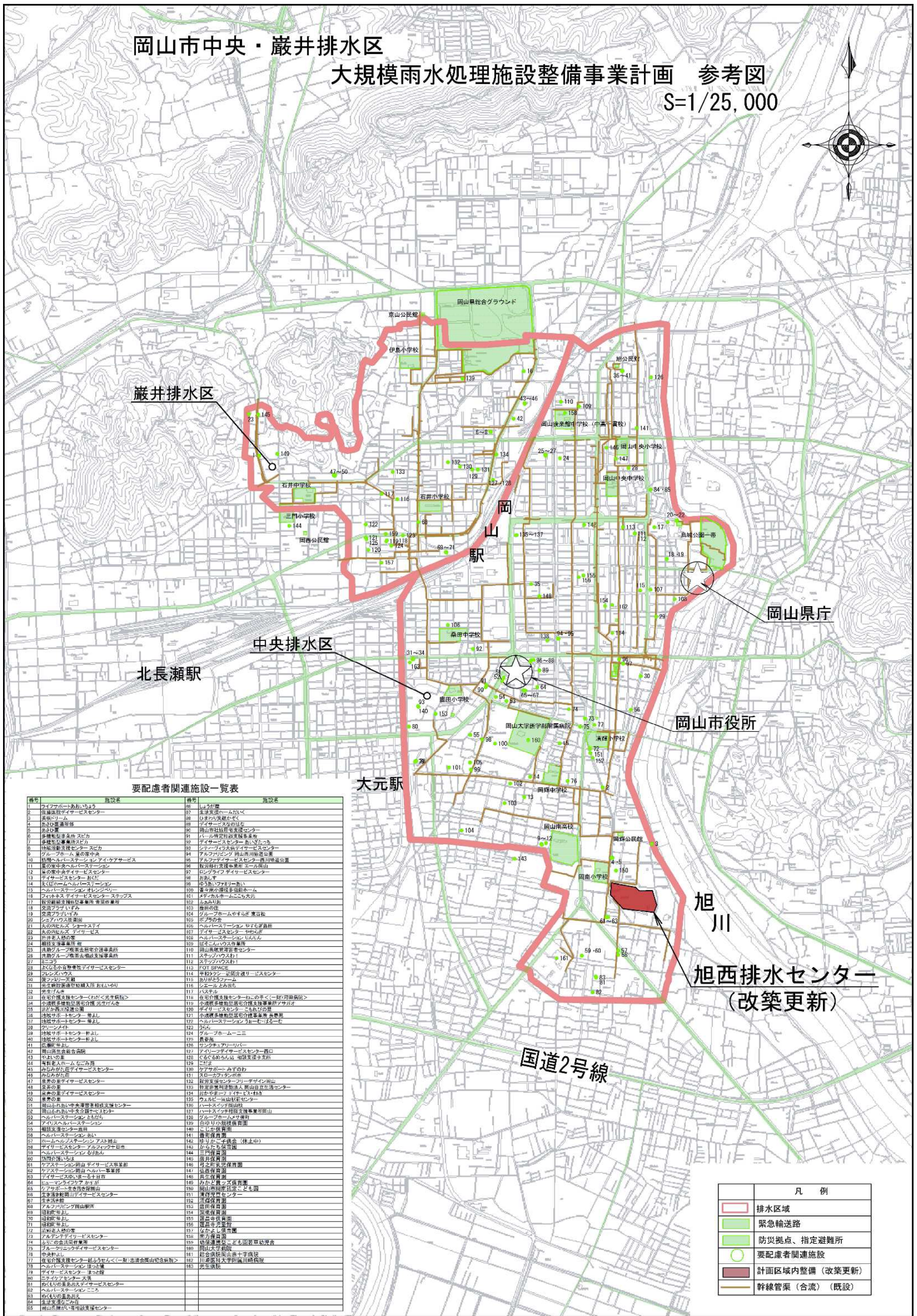
要配慮者関連施設一覧表