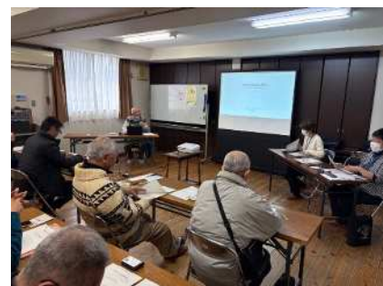
【昨年の受講の様子】