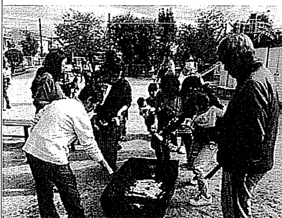
11月2日 焼きいもをしよう 参加者 52名うち地域の方2名参加