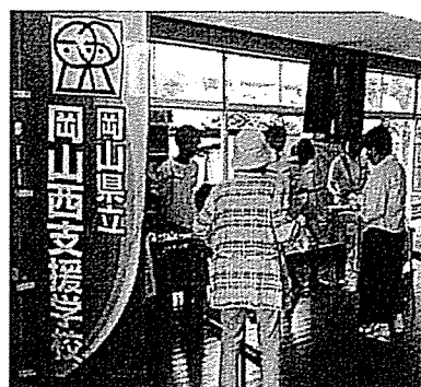
6月15日 岡山西支援学校生徒 による野菜販売