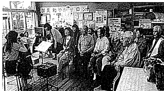
4月5日 お花見 参加者 28名うち地域の方10名参加