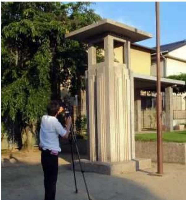
たこ公園内にある「ラジオ塔」

講演は、全国のラジオ塔に関する取材内容を多数のスライド写真を使って講演をされました。雑誌を読んで知っている事でもスクリーンに映し出される写真と生の取材話を聞いて皆様も新たな感覚になった事でしょう。昭和10年代に作られ、終戦前には役割を終えたと考えられる薄命の遺物。音楽や、スポーツ放送の娯楽に利用された一方で戦時中は国民の戦意高揚に巧妙に利用されるなど当時のラジオ効用価値は大変高かった。また、全国でも500基程度の設置の中で岡山県は12基確認という。その中で現存している奇跡の塔は30基程度。その希少なラジオ塔の一つにたこ公園の塔が該当するのだ。これは、まさに「地域の遺産」でしょう。