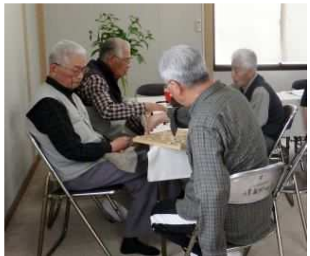
男性の参加者は、囲碁と将棋に夢中！

また、おばあさん&おじいさんの知恵袋を使って個人の生きがいに繋がる行動も起こしたい。でも焦らず自然な流れに任せた運営を継続させたい。……とオープンにあたっての考えが示されました