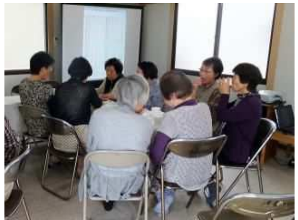
早くも女子会？ 井戸端会議？ 脳トレの学習も行なわれたようです！

とにかく気軽にお喋りに来て下さい。美味しいお茶を皆で飲み、趣味や井戸端会議を通じてふれあい楽しい時間を過ごして頂くことが目的です。その交流中から高齢者の生活に必要なチョットした支援活動（高い場所の電球交換、網戸の張替や重い物の移動等）が出来ればうれしい。カフェを通じて相談する人が出来れば、オレオレ詐欺や悪徳商法にかかることもないでしょう。