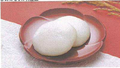
白餅 ヒメノモチを100%使用した杵つきのこしの強い丸餅です