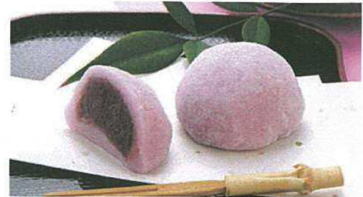
あや紫大福 つきたての風味とアヤマラサキの彩りが素朴で懐かしい。