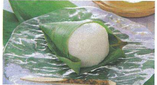
笹餅 笹の葉の滋味豊かな、しっとりとしたお餅です。