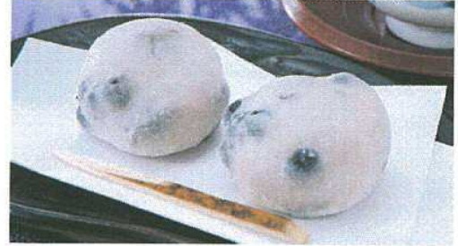
豆大福 こしあんと黒大豆の風味・香ばしさが 口いっぱいに広がります。