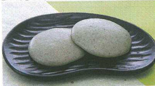
よもぎ餅 ヒメノモチに良質のよもぎを入れて丁寧に仕上げた餅です