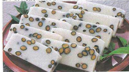
豆餅 黒大豆の風味が口いっぱいに広がり 香ばしさが食欲をそそります。