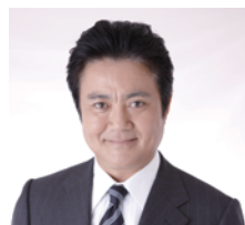
堀尾 正明 氏 (フリーアナウンサー)