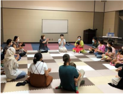
歌に合わせて自分の名前を言うことで自己発信ができた