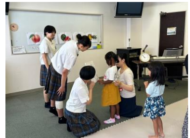
活動を通して次世代の多文化共生理解促進