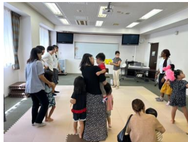
体を動かすことで心の解放が図れた