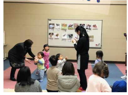
親子で一緒に日本語が学べた