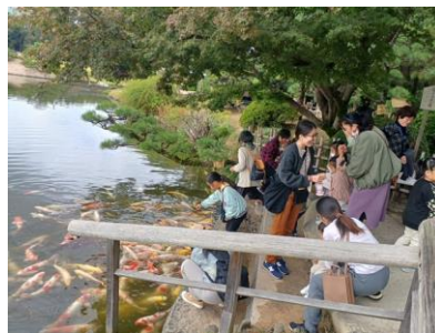
課外活動により経験値を積むことができた