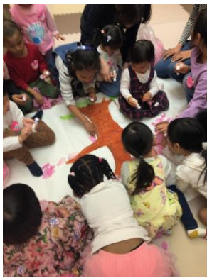
活動を通して同じ外国にルーツを持つ友だちができた