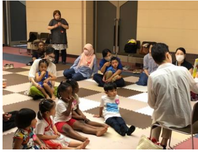
絵本の読みきかせによる日本語のリズムになれ言葉が増えた