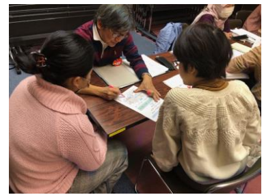
個々のニーズに対応した日本語習得