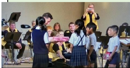
演奏会での記念品 交換

毎回地元音楽愛好家等との共演で実施 (2013年は旧建部町内3小学校児童 との交流音楽会を実施。) 過去5回の集客総数 約1700人