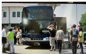
建部に到着！ 楽しい日々スタート