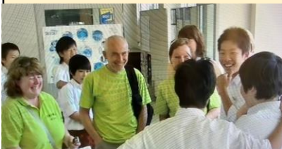
建部中学校に 突撃訪問

毎回20家庭程度 (過去5回 延べ100家庭) 近隣の友人知人と共に地域散策等 で交流も。