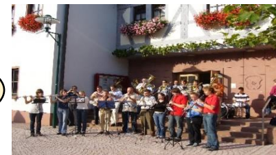
音楽グループ活動の様子 (メムリンゲン庁舎前)

毎回40名(演奏者30名+随行者10名)程度来訪(過去5回 延べ200人超え) 演奏会を中心とした交流事業の主役であり全体運営を支援