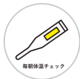
毎朝体温チェック