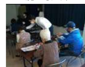
スマホ決済を学ぼう