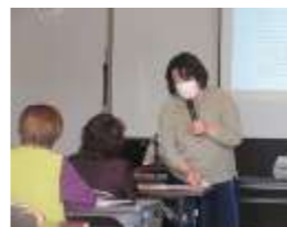
プラスチックゴミによる汚染