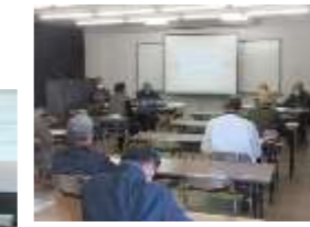
減災・防災講座 ←血糖値が気になる方の食事