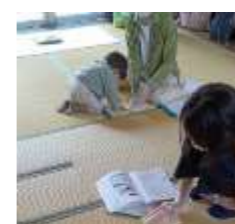
女性のための健康づくり応援講座