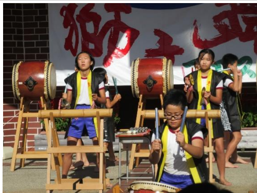
↑恒例の御津南小の太鼓演奏でステージ幕開け