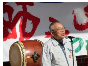
←公民館祭り実行委員長の挨拶でスタート！