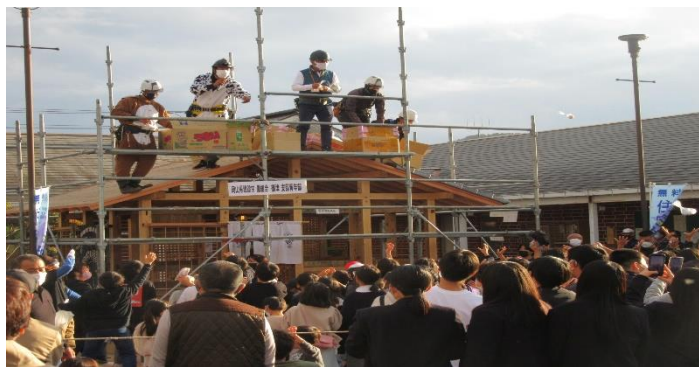
←建芳青年部の餅まきで盛り上げました！