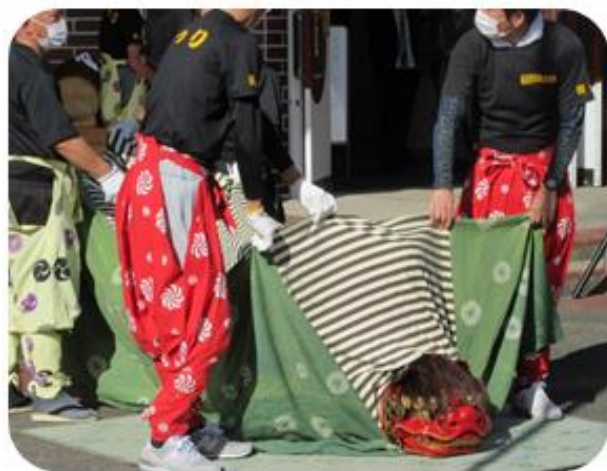
→新庄獅子舞が熱演