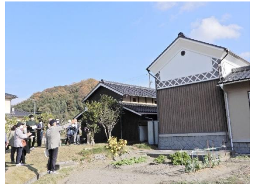
↑大原美術館の名画が疎開していた倉

昭和20年に、大原美術館の名画が日近へ疎開していたというのを聞いて、えっ？そんな身近な所に？とびっくりしました。と言っても30年ほど前の山陽新聞に載っているのですが、私が見られなかったのですが、新聞のコピーを読むと、疎開先を探すのも一苦労。B29に狙われない場所で、まじめな人柄で絵画を保管出来る蔵のある家という条件をクリアしたの