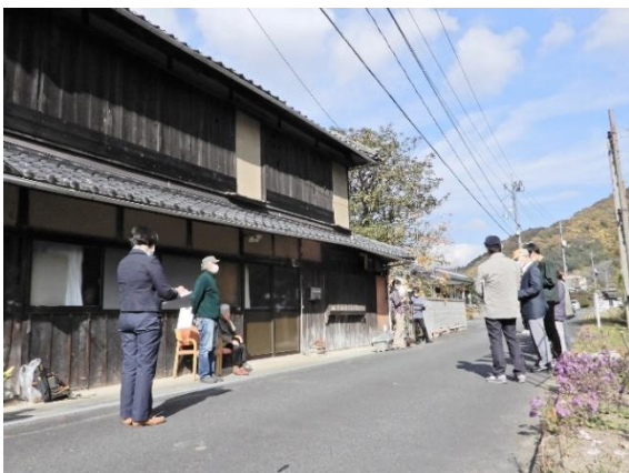
↑松根油工場で働く予科練生の宿舎になったお宅

Iさんのお話は、 ①福谷松根油工場 ②お兄さんの手文庫 についてでした。 ①太平洋戦争末期、石油不足の日本は、松の根を掘り、その根に含まれている松脂を精製して航空燃料に充てようとした。福谷松根油工場は西山内にあり、Iさんの家は、その工場で働く予科練生の宿舎となりました。航空燃料不足や国内各地が空襲を受けている状況でも日本は、まだ戦おうとしていたのですね。 ②お兄さんは、東京の憲兵学校に入り、終戦後に朝鮮で行方不明になりました。お兄さんは、東京に行くときにいろいろ書いて手文庫に納められた。お兄さんが開けるものと帰りを待っています。終戦から77年経った今も消息不明のままです。 今年95歳になるIさんは、はつきりとした口調で淡々と話されましたが、辛い思いをずっと胸に抱えて生きてこられたことをひしひしと感じました。 坪井 智子