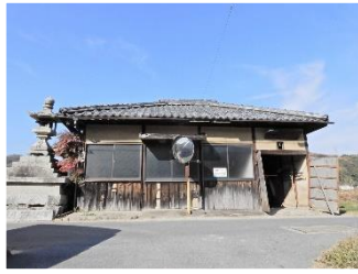
←大井村警防団機庫