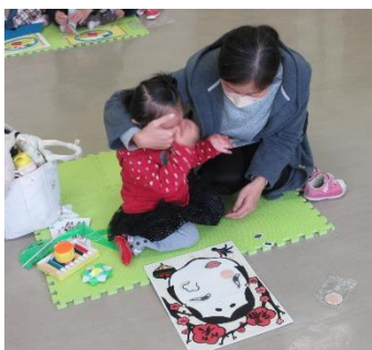
目を隠して、福笑いに挑戦！

保育園やこども園に入園するまでの短期間ですが、いろいろな体験が出来て親子のふれあいを深める貴重な機会となります。また、同年齢の子どもをもつ保護者同士のつながりの場にもなります。来年度も5月から開催を予定しています。ぜひ公民館をご利用ください。