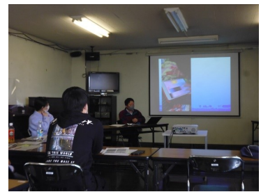
オレンジクローバーの会(1/22) 「スマホ・SNSとの付き合い方」