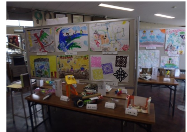
ロビー展 (2/4~2/17) 「小学校作品展」