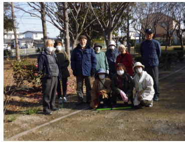
「健康ウォーキング」 (1/20)