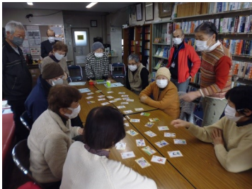
公民館カフェ (2/3) 「サポくまカルタ」