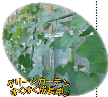
グリーンカーテン おくすく成長中。

公民館利用の際には、引き続き、来館前の体温測定・体調のセルフチェック等、ご協力をよろしくお願いいたします。