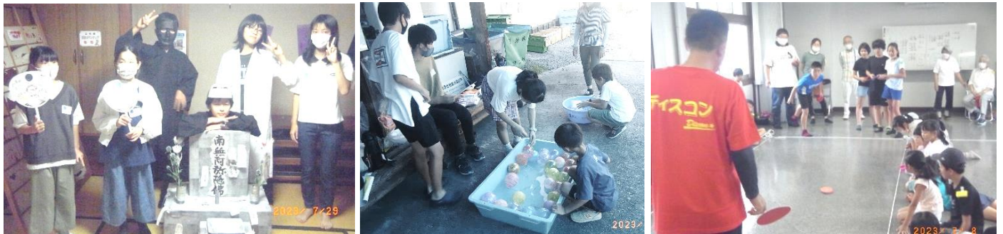
↑中学生が企画・運営した「ちびっこ夏まつり」お化け屋敷や、射的、人間双六、ヨーヨーつりなど、小学生がいろいろなゲームを楽しみました。↓