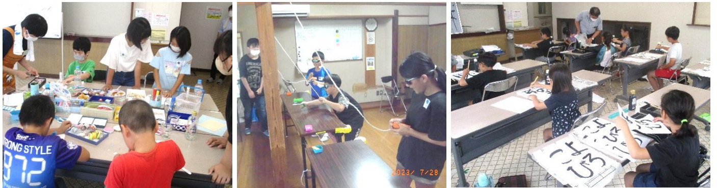
↑ ディスカンにも挑戦! 書道教室もありました! ↓