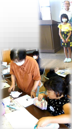
【どの色を塗るか考えて】