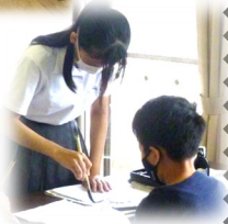
【高校生のお手本を見て】