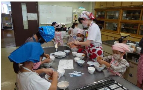
和菓子づくりでお団子を作っているところ

今後は「東山 ESD クラブ」「東山公民館文化祭」等でも活躍していただく予定です。