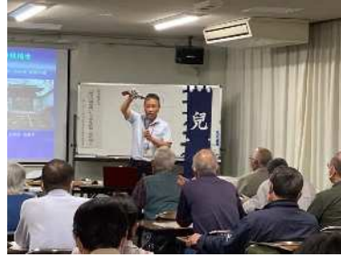
上南高齢者大学 (10/12) 「岡山の礎を築いた宇喜多直家・秀家親子」