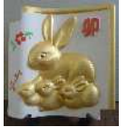
昨年の干支卯の瓦写真

日時 12月9日(土) 10:00~12:00 内容 来年の干支「辰」の素焼きの瓦に、絵の具で絵付けします。 (瓦の大きさ 20cm×20cm) 昨年の干支卯の瓦写真 講師 (有)廣安瓦建材さん 対象・定員 どなたでも・10人 (小学3年生以下は、保護者と参加してください。) 材料費 1,000円(当日集金) 持ち物 水彩絵の具セット、新聞紙2日分 雑巾、持ち帰り用の袋 〆 切 11月30日(木)17時(先着順)