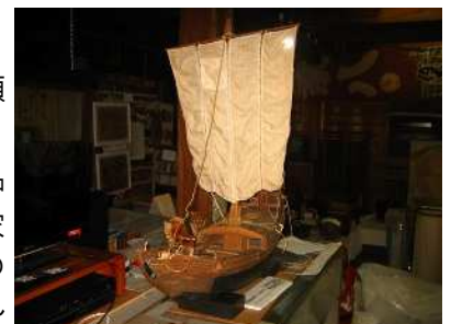
西大寺文化資料館の北前船

今回の北前船寄港地フォーラムの会場には、私たちの「上南今昔絵図～沖新田八十八ヶ所札所巡り～」が「西大寺観音院会陽之図」や「金岡湊の旧家に保存されていた北前船と思われる模型」とともに展示されました。今回のフォーラムが、地元の歴史に誇りを持つためのきっかけの一つになってくれることに期待したいと思います。