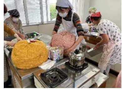
はじめよう! エコライフ (10/14) 「鍋帽子を使ったエコクッキング」