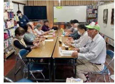
公民館カフェ(10/6) 「脳トレで頭の体操」