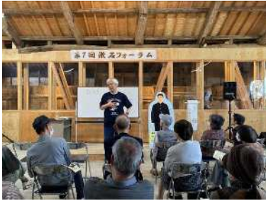
第7回漱石フォーラム (10/8) 「～漱石ファン～ハマイエ 人生100年時代を語る!」