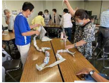
上南いきいき教室 (9/19) 新聞ちぎりゲームをしました。