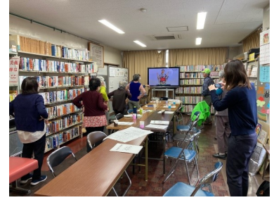
公民館カフェ (11/10) 「みんなであたおう」

☆☆☆☆☆☆☆☆☆☆☆☆☆☆☆☆☆☆☆☆☆☆☆☆☆☆☆☆☆☆☆☆☆☆☆☆☆☆☆☆☆☆☆☆☆☆☆☆☆☆☆☆☆☆