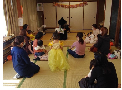
ちびっこわいわい(10/23) 「ハロウィンパーティー」