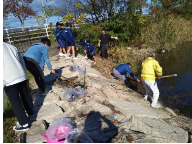
海ごみワークショップ(10/29) 六番川水の公園で清掃活動