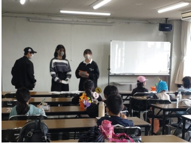
みんなあつまれ! (10/28) 「ハロウィンパーティー」