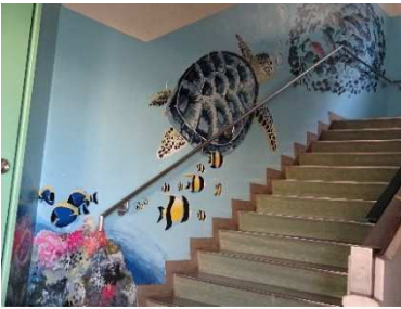
【2号館の階段の壁(1階)】