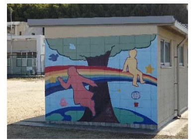
【運動場の部室の壁】