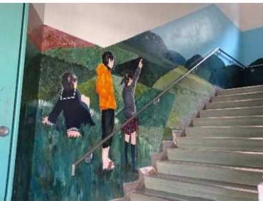
【2号館の階段の壁(2階)】