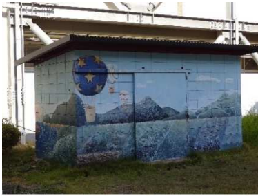
【中庭の倉庫の壁(1作目)】

実は、同校美術部は、平成二十年（二〇一〇年）から、校舎の壁などに大きな絵を描いて学校全体を美術館にする計画、すなわち「校内美術館化計画」に取り組まれています。これは、部員同士で協力しながら一つの作品を創り上げることで、部員同士のコミュニケーションを図ることと、芸術をもって校内を美しくすることを目的として始められました。