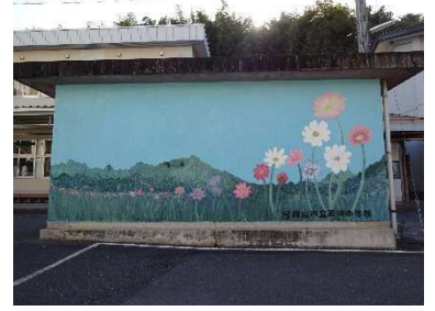
【玄関近くの倉庫の壁】

である地域の移り変わりを表現した全長約二十五メートルの作品です。一階から三階まで上がるにつれ、色とりどりの魚やウミガメが舞泳ぐ干拓前の海から、緑豊かな灘崎の平野、正面にそびえる常山、そして透き通る青空へとつながる壮大な作品となっています。これは、夢や目標に向かって突き進んで行こうとする子どもたちに、勇気を与えるものになっています。