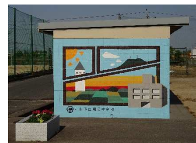
【運動場の部室の壁】

ます。三作目は、校舎四号館の下足箱付近の壁に描かれた、樹木がテーマの作品です。四作目は、三作目と同じ下足箱付近の壁に描かれた、濃淡のある色遣いが印象的な作品です。その後も、倉庫や部室の壁、手洗い場の壁、廊下の柱など、年々素晴らしい作品が増えていきます。