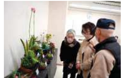
作品展示会場の様子