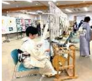
作品展示会場の様子