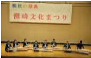
エンディングを務めた 灘崎中学校箏曲部