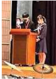
司会を務める灘崎中学校生徒