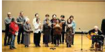
大ホール会場の演技