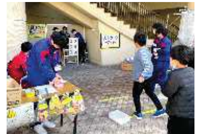
「チーム灘」運営のストラックアウト