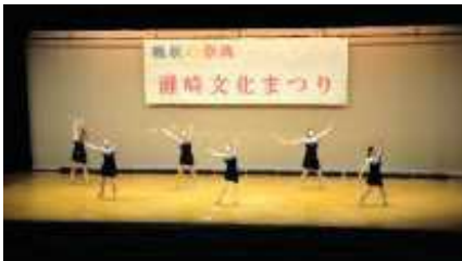
大ホール会場の演技