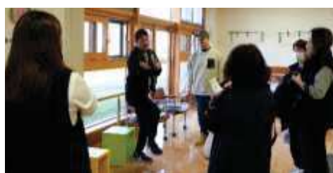
体験コーナーの様子