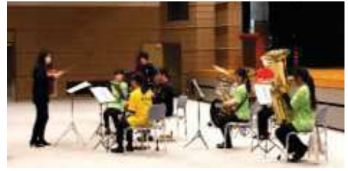
オープニングを飾った灘崎中学校吹奏楽部