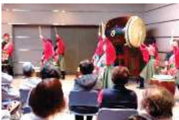
小ホール会場の演技