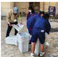
活躍する中高生ボランティアの様子