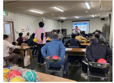
上南いきいき教室(12/19) 「座位時間を減らして健康に」