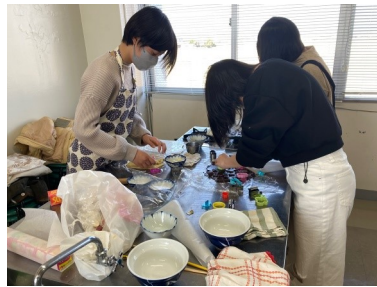
放課後J-school(12/26) 「お菓子を作ろう！」