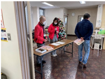
東区社会福祉協議会 レクリエーションや受付などのお手伝い