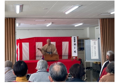
上南高齢者大学 (1/11) 「新春初笑い落語会」