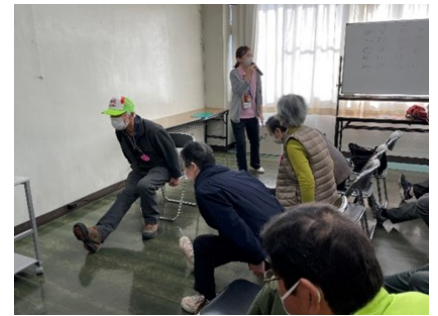
ふれあい介護予防センター あつ晴れ！もも太郎体操