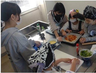
みんなあつまれ！ (12/23) 「ピザを作ろう！」