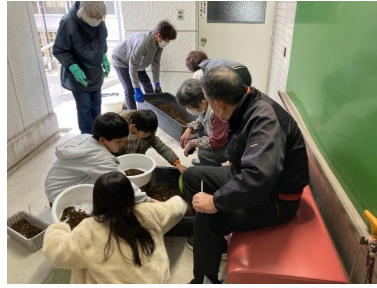
地域ふれあい事業(12/16) 「クリスマスガーデニング」