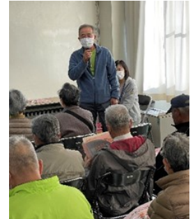
政田・開成地区民生委員・児童委員、サロン代表者のみなさん 前日の会場準備から、企画・進行・運営スタッフに積極的に協力してくださいました。