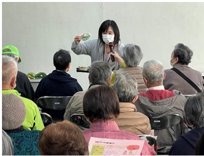
東区保健センター 低栄養予防のための食生活チェック

東区地域包括支援センター、東区社会福祉協議会、ふれあい介護予防センター、東区保健センター、政田開成民生委員・児童委員協議会の協力のもと、「健康を考えよう」をテーマにレクリエーションや講話などを行い、参加者の方にサロン活動について知ってもらう機会になりました。