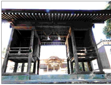
↑大井神社の随神門から本殿を望む

前回、福谷の天神社に大典記念碑があると紹介しましたが、なんと大井神社にもありました。福谷と同じく昭和3年に建てられています、こちらは単に記念碑を建てるだけでなく石段も整備されたようで、隣に『大典記念 石段寄附者』の石碑が建っています。寄付金の最高額は五十円で、今どきパン一個も買えませんが、この頃には大金だったんでしょね。