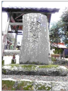
『犬養毅書』の記念碑→