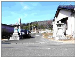
↓日近川東側、大井神社参道の灯籠