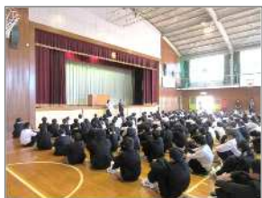
「中山中の体育館」にて、一生懸命に働く我々生徒の皆さんの姿が印象的でした。

【定員】30名 【参加費】無料 【申込み】6/13(木)9:30より窓口・電話で受付