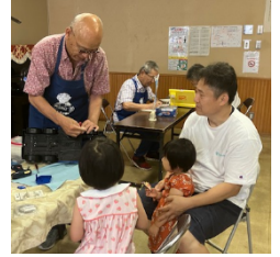
おもちゃを修理している様子

※おもちゃの病院はお子さんとドクターさんのふれあい等を通して、ものを大事にする気持ちを育む場所です。お子さんの前で修理します。お子さんと一緒にお越しください。