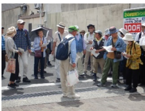
↑オランダおイネ修業地前での案内風景

講師からの詳しい説明を受けながらの見学会。新しい発見にたくさん出会えた会になりました。みなさん、お疲れさまでした！！