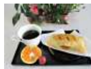
11月のお菓子「秋のパイ」