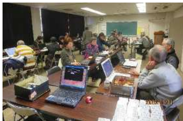
↑2020年の楽習会の風景

づくりを進めること」を会の目的に掲げ、「パソコン楽習会」だけでなく、小中学生を対象に「親子パソコン体験会」を開いたり、依頼を受けて芥子山小学校の情報教育の授業の支援をされたりもしました(市立公民館の職員を対象にエクセル講習会をしてくださったことも!)。みんなで教え合っ、楽しく学ぶ、「楽習会」。どれほどたくさんの方が、この会のおかげで楽しくパソコンに触れるようになったことでしょう。長い間、本当にありがとうございました。