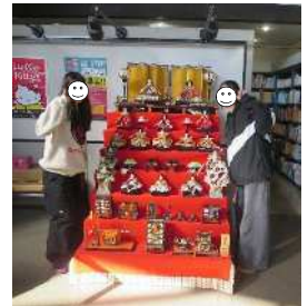
↑中学生とおひなさま♪