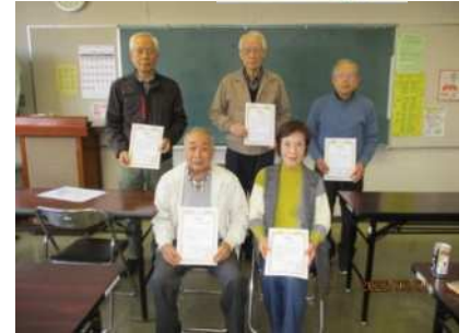
↑旭東ネットワーククラブのみなさん

旭東公民館を拠点に2002年にスタートし、24年に渡って地域の方々のパソコンの悩みや楽しみに寄り添い続けた講座「パソコン楽習会」が、今年3月に終了しました。講座を運営してくださっていた「旭東ネットワーククラブ」の5人のメンバーの方々に、旭東公民館運営委員会と公民館から、感謝状を贈呈いたしました。まだパソコンが家庭に普及し始めて間もない2000年頃から「情報技術を共に学び合うことを通して、旭東地域に顔の見えるネットワークを育て、この地域に住んでよかったと思えるような地域